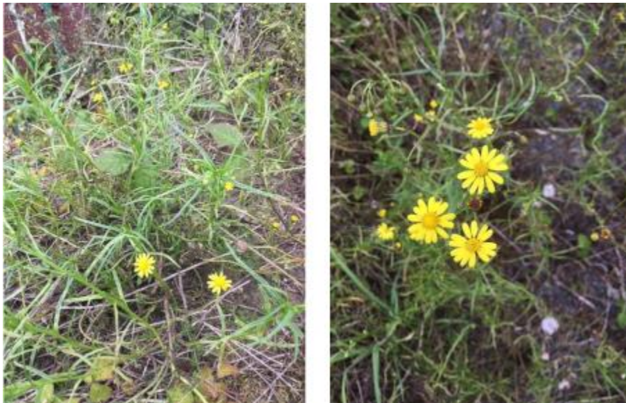
Abbildung 9: Schmalblättriges Greiskraut auf einer Brachfläche

Die mehrjährige Pflanze kommt ursprünglich aus Südafrika und hat sich hierzulande vorwiegend entlang von Verkehrswegen, v.a. Straßen und Bahntrassen, etabliert, in der freien Landschaft bisher eher selten. Sie ist von Grund an stark verzweigt, mit zuerst am Boden anliegenden, oft verholzten Zweigen, und erreicht eine Höhe von 40 – 100 cm. Die schmalen, ungeteilten Blätter unterscheiden die Art leicht von anderen Kreuzkräutern. Blütezeit ist Juni bis November (Dezember). Samen können sehr lange im Boden überdauern (30 – 40 Jahre).