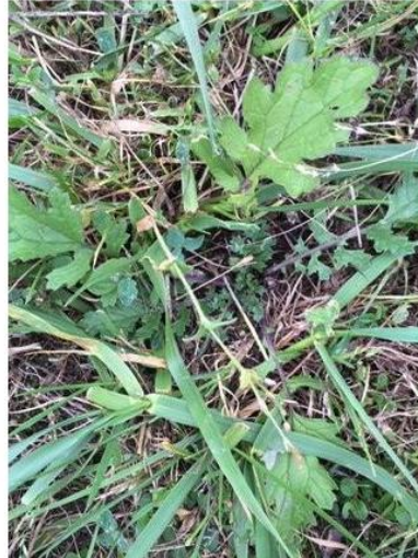
Abbildung 6: Im Rosettenstadium kann das Jakobskreuzkraut mit anderen Arten verwechselt werden oder ist im Gras besonders leicht zu übersehen.