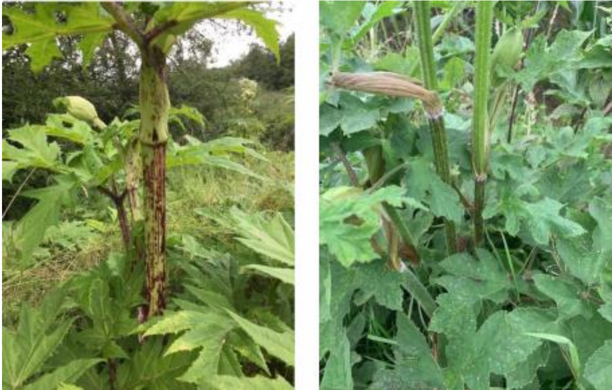
Abbildung 3: Riesens-Bärenklau (links) und Wiesens-Bärenklau (rechts) sind gut anhand der Stängel zu unterscheiden: Der Riesens-Bärenklau zeichnet sich durch seine roten Flecken aus, die beim Wiesens-Bärenklau fehlen.

Es gibt noch eine Reihe weiterer Arten, mit denen der Riesens-Bärenklau vor allem im Jungstadium verwechselt werden kann. Um unnötige Kosten für eine Beseitigung von Verwechslungsarten zu vermeiden, sollte der Riesens-Bärenklau daher immer von einem Fachverständigen identifiziert werden.