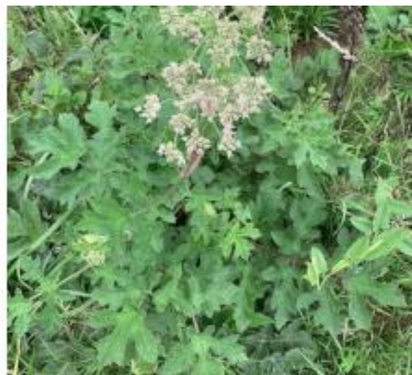
Abbildung 2: Die Blätter des Wiesen-Bärenklaus (rechts) sind kleiner und weniger spitz als die des Riesen-Bärenklaus (links).