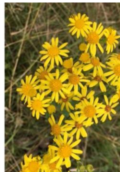
Abbildung 7: Die Blätter des Rainfarns ( Tanacetum vulgare ; links) sehen denen des Jakobskreuzkrauts ähnlich, allerdings bildet die Blüte (Mitte) nur Röhren- und keine Zungenblüten aus und ist damit gut vom Jakobskreuzkraut (rechts) zu unterscheiden.