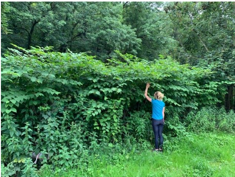
Abbildung 4: Die Knöteriche bilden dichte, hochwüchsige Dominanzbestände, deren Bekämpfung in der Regel ein Kampf gegen Windmühlen ist.

In Deutschland kommen drei Arten vor: Japanischer Staudenknöterich ( Fallopia japonica ), Sachalin-Staudenknöterich ( Fallopia sachalinensis ) und die Kreuzung beider, der Böhmisches oder Bastard-Staudenknöterich ( Fallopia x bohemica ). Der Japanische und der Sachalin-Staudenknöterich wurden ungefähr Mitte des 19. Jahrhunderts nach Europa aus ihren ursprünglichen Verbreitungsgebieten (China / Ostasien bzw. russischer ferner Osten / Ostasien) für den Gartenbau eingeführt und sind heute in Deutschland weit verbreitet. Der Bastard-Staudenknöterich besitzt kein ursprüngliches Areal und ist eine Kreuzung aus den beiden Arten, die in Europa ihren Ursprung hat.