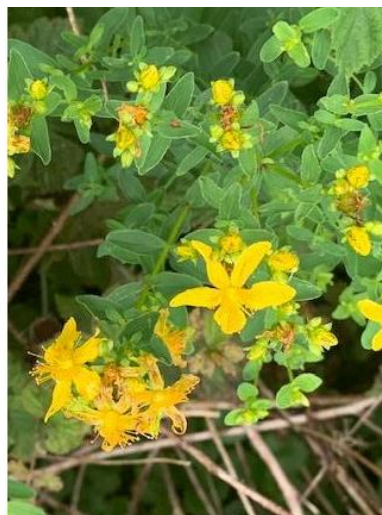
Abbildung 8: Das Johanniskraut ( Hypericum perforatum ) ist häufig an ähnlichen Standorten wie das Jakobskreuzkraut zu finden und blüht zur gleichen Zeit. Die Blätter sind allerdings oval und nicht gefiedert. Die Blüte besteht aus 5 goldgelben Kronblättern und ist damit leicht vom Jakobskreuzkraut zu unterscheiden.