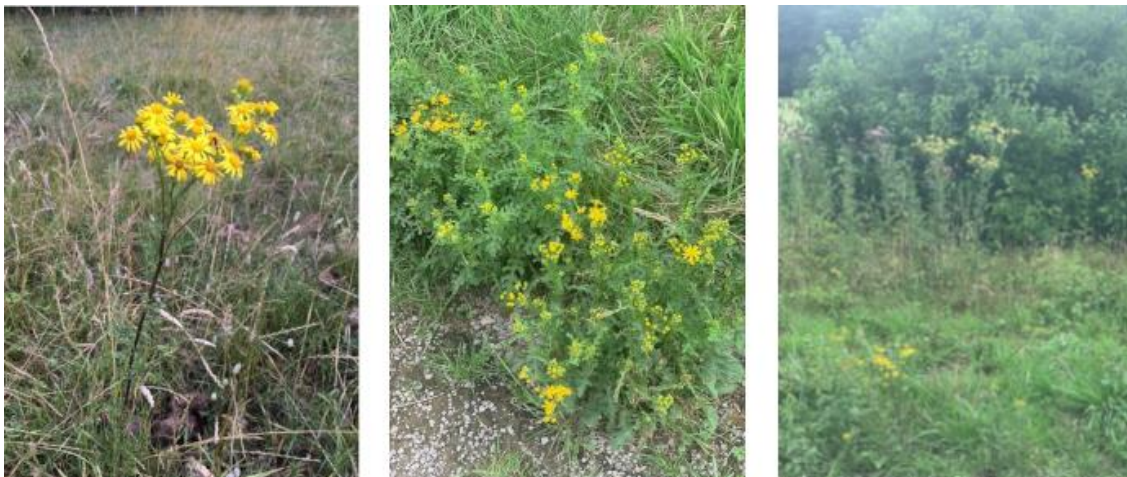
Abbildung 10. Links: Jakobskreuzkraut auf einer Pferdewiese, auf der Einzelpflanzen mehrmals pro Jahr ausgestochen werden. Mitte: Entlang eines Feldwegs, an dem zweimal jährlich gemäht wird. Auffällig ist die buschartige Ausbildung der Pflanze, die sehr viel mehr Blüten entwickelt. Rechts: Im Vordergrund, kleine, buschige Pflanzen, die regelmäßig gemäht werden; im Hintergrund ungestörte Pflanzen.

Eine Mahd ist grundsätzlich vor allem zur Verhinderung der Aussamung geeignet, nicht aber für eine Beseitigung der Bestände. Vor allem das schmalblättrige Greiskraut ist sehr gut mahdverträglich (und zudem resistent gegenüber Herbiziden). Regelmäßige Mahd kann sogar die Populationen begünstigen, deshalb sollte das Ausreißen immer bevorzugt werden. Bei sehr großen Beständen sollten die Maßnahmen kombiniert werden, d.h. den Bestand von außen ausreißen, während die innere Kernzone zur Verhinderung der Aussamung gemäht wird. Abgemähte Pflanzen treiben schnell wieder aus und können innerhalb kurzer Zeit erneut zur Blüte kommen, daher sind regelmäßige Kontrollgänge unumgänglich. Es wird ein mindestens dreimaliger Einsatz während der Vegetationsperiode empfohlen. Durch die meist großen langlebigen Samenbanken müssen für eine effektive Bekämpfung mehrere Einsätze über mehrere Jahre eingeplant werden. Bei Vorkommen des schmalblättrigen Greiskraut scheint eine gleichzeitige Übersaat mit Arten von hohem Bodendeckungsgrad (Klee, Luzerne) vielversprechend.